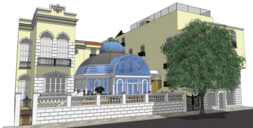
Figura 3: entrada principal

De igual modo, os aparelhos ou grupos de aparelhos de aquecimento ambiente devem ser instalados em centrais térmicas. Tal construção deve garantir os riscos de incêndio e reação ao fogo.